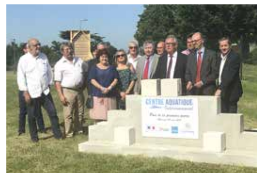
Pose de la première pierre du futur centre aquatique de Loudun. Le Département finance à hauteur de 2,7 millions d'euros sur un coût total de 9 millions HT.