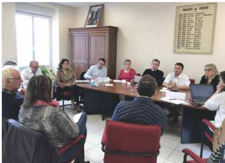
A la rencontre et à l'écoute des élus de Dercé

Être des élus de proximité, nous vous en avons fait la promesse il y a 3 ans. Nous la tenons !