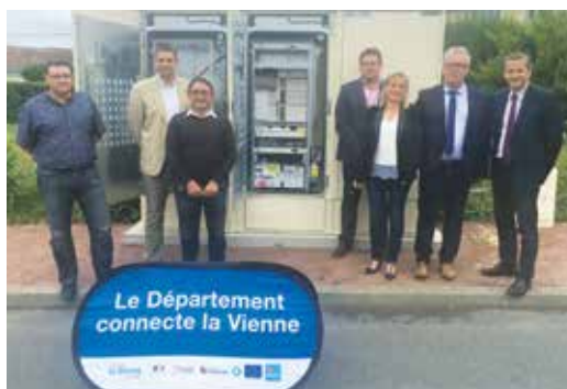
Inauguration de la montée en débit de Roiffé. 116 montées en débit dans le département dont plus d'une vingtaine sur le canton de Loudun d'ici fin 2019.