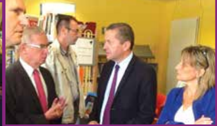
Vos Conseillers Départementaux en action sur le terrain...